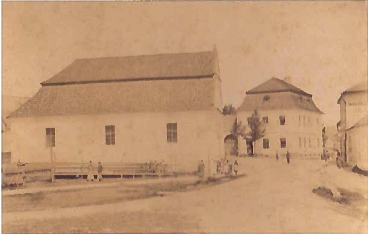
Komenského náměstí, toleranční modlitebna z roku 1784.

Roku 1784 vznikla uprostřed Husího rynku (Komenského nám.) nová, skromná stavba toleranční modlitebny.