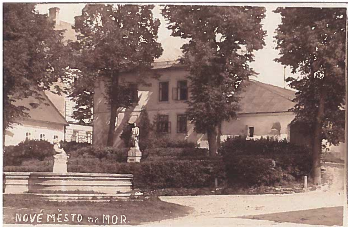
Palackého náměstí, počátek 20. století

V roce 1902 získalo novou tvář i Dolní (Palackého) náměstí, které ovládl pozoruhodný pomník Františka Palackého od sochaře Jana Štursy.