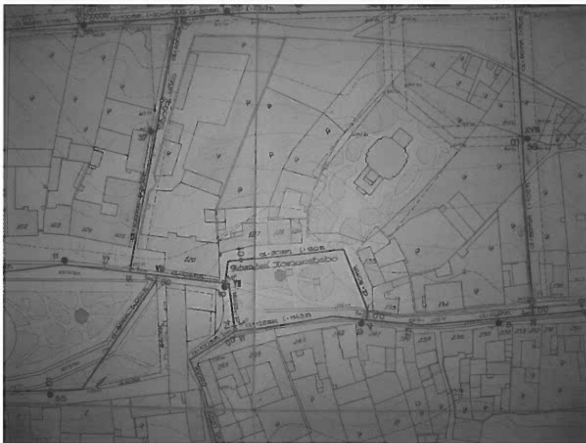
Plán Komenského náměstí a části Masarykovy ulice z roku 1931 (před asanací)

V roce 1990 se Nové Město na Moravě stalo městem s městskou památkovou zónou. Tato skutečnost a změna politických poměrů po roce 1989 odstartovala ve městě čilý stavební ruch.