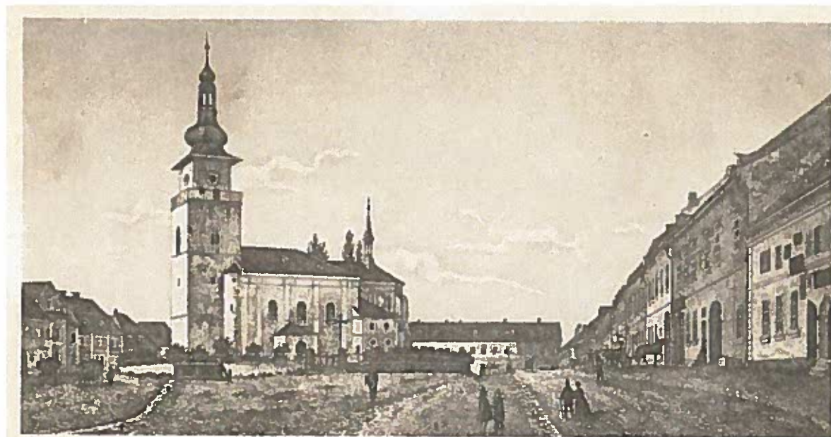
E. Moser. Pohled na Nové Město z let sedesátých min. století. Oceloryt.

V roce 1540 pak Jan z Pernštejna povolil obci skoupit východně od města ležící ves Mnichov (Michov), jejíž pozemky vhodně rozšířily základnu starých i nových obyvatel města.