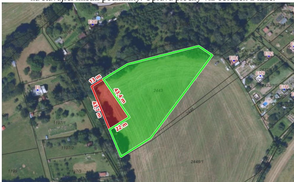
Obr.2: Návrh úpravy plocha Z.193 v návrhu Změny ÚP NMNM.

S ostatními zastavitelnými plochami je vyjádřen souhlas.