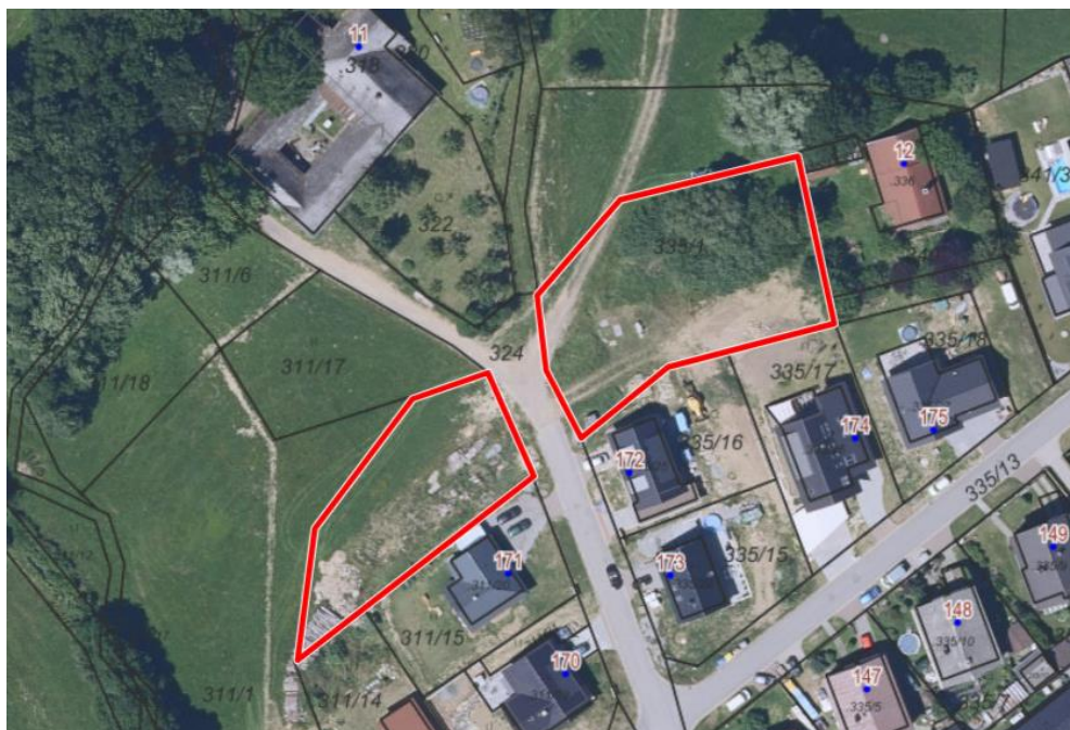
Obr. 1: Návrh úpravy plocha Z.171 a Z.172 v návrhu Změny ÚP NMNM.